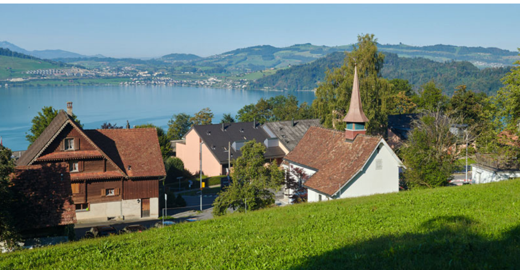
Einzigartige Parzelle oberhalb der denkmalgeschützten Kapelle St. Antonius

Die einmalige Parzelle am Walchwilerberg am Ostufer des Zugersees – zwischen Zugerberg und Rossberg – bietet die besten Voraussetzungen für hochwertiges Wohnen. Die Nähe zum Dorf, zum See, zum öffentlichen Verkehr und zu den Autobahnen Richtung Zürich, Luzern oder Schwyz/Gotthard verspricht hohen Lebenskomfort. Geniessen Sie den Blick in die Weite, nutzen Sie das fantastische Naherholungsgebiet oder lassen Sie einfach die Seele baumeln an diesem sonnenverwöhnten Hang mit südlichem Flair. Weinreben, Edelkastanien, Kirschen und Feigen inklusive.