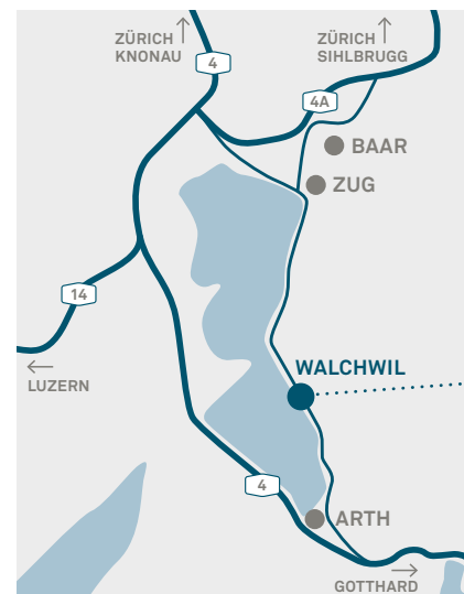
Rasch in Zug, Zürich, Luzern und Schwyz